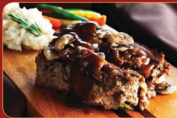
PÂTÉ DE VIANDE

Bâtonnets de poulet panés, passés à la grande friture et servis tel quel ou assaisonnés de sauce barbecue douce ou bison, à votre choix. 11,49 $