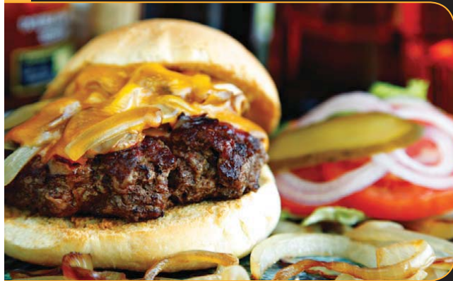
HAMBURGER BARBECUE MAISON