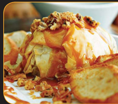
BRIE EN PÂTE FILO, AUX POMMES ET AU SIROP D'ÉRABLE

Fromage havarti léger incorporé à des rouleaux de printemps bien dorés en friture. Servi avec une sauce aux tomates. 9,99 $