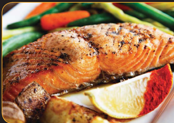
SAUMON FUMÉ M.I.C. GLACÉ

Portion de 8 onces de saumon d'Atlantique de la Nouvelle-Écosse, fumé à la mode M.I.C. et nappé d'une sauce crémeuse à l'aneth et à la moutarde de Dijon. Servi avec des pommes de terre rôties. 21,99 $