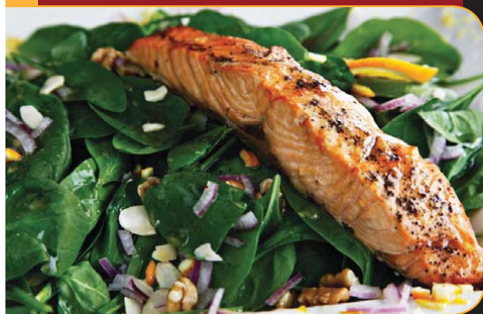
SALADE AUX ÉPINARDS ET AU SAUMON FUMÉ M.I.C