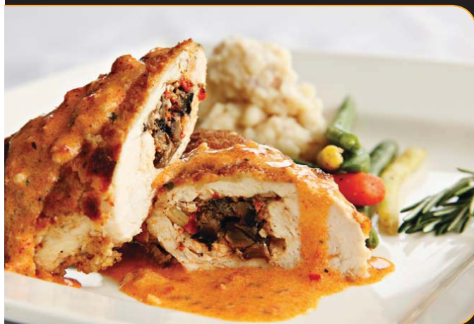
POULET FARCI AU PORTOBELLO

Les plats suivants sont servis avec votre choix de pommes de terre rôties, au four ou en pure à l'ail.