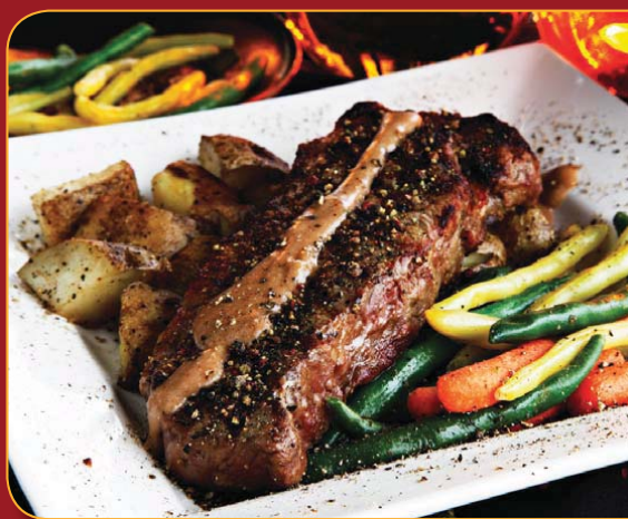
LE MONTAGNARD DES ROCHEUSES

Médallions de bœuf grillés à la perfection, puis garnis de poireau et de champignons sautés, et nappés de notre propre réduction de porto. 25,99 $