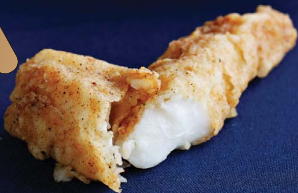
BÂTONNETS DE POISSON FAITS MAISON