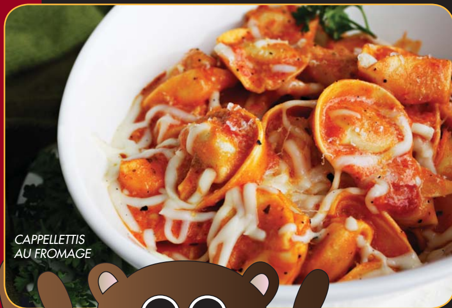
CAPPELETTIS AU FROMAGE